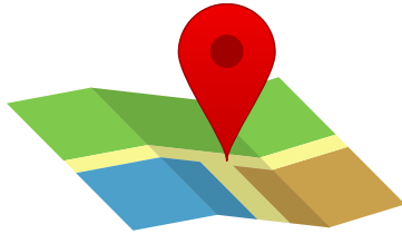
Prueba de residencia