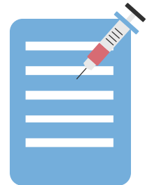
Certificado de vacunas